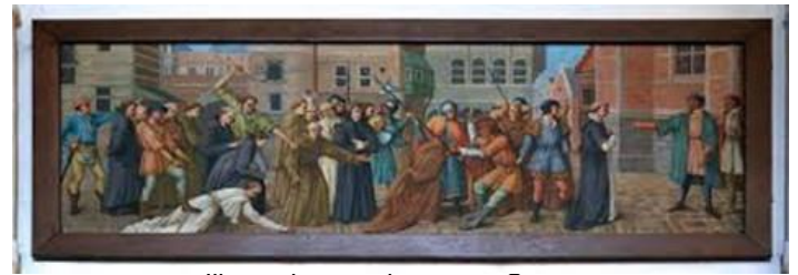
Illustratie martelaren van Gorcum

Over de doodsoorzaak van de negentien geestelijken bestaat geen twijfel. Zij werden op 9 juli 1572 in een turfschuur in Rugge, even buiten Den Briel aan de balken opgehangen.