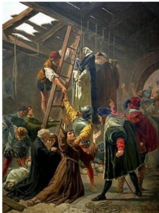
Martelaren van Gorcum

In 1572 werden negentien geestelijken (17 priesters en 2 broeders), die bekend zijn geworden als de martelaren van Gorcum, opgepakt door de Watergeuzen (kapers en vrijheidsstrijders), naar Den Briel