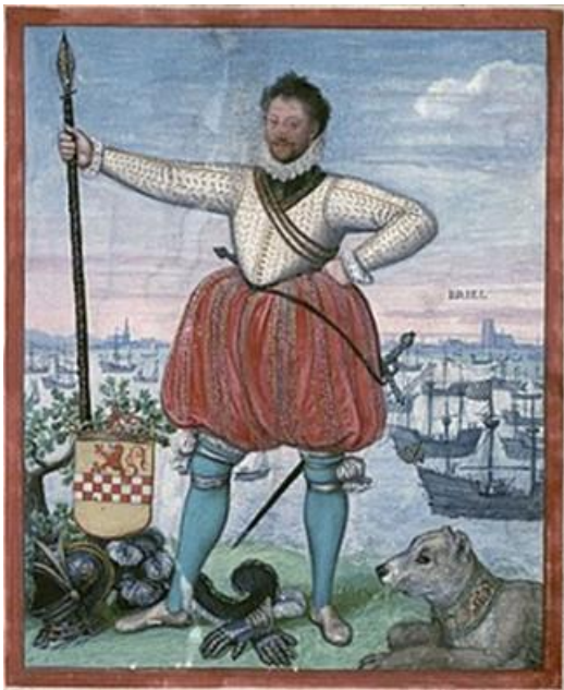
Willem van der Marck, heer van Lumey