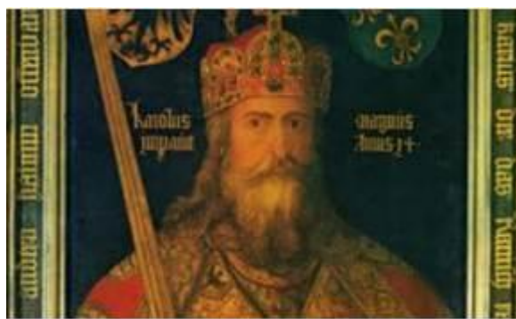
karel de grote

hertogdom in handen van achtereenvolgens hertogen uit het Bourgondische en Habsburgse huis. Bijsterveld verlucht zijn lezing met afbeeldingen en kaarten en biedt hij een verhelderend beeld van een duistere periode. In februari 2013 was hij al eerder te gast van de Kring met een lezing die als titel had: 'We zullen er ondanks alles de moed maar inhouden.' In deze lezing stond de hardwerkende Brabander centraal. De bezoekers van toen weten zonder twijfel nog steeds dat Arnoud-Jan Bijsterveld een zeer begenadigd spreker is en de belangstellenden van begin tot eind weet te boeien. Dat belooft dus veel voor de eerstvolgende lezing van de OKG.