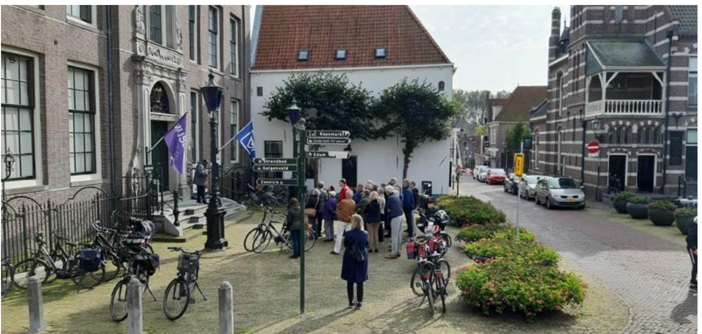
Links het voormalig stadhuis rechts het voormalig postkantoor

Verder telt Edam maar liefst 177 Rijksmonumenten en zo'n 65 gemeentelijke monumenten; kortom heel veel bezienswaardigheden. Het programma zat dus boordevol en na de koffie met gebak in restaurant L'Auberge Damhotel, waar later genoten werd van een uitgebreide en prima verzorgde lunch, werd snel gestart met de rondleidingen door het museum met de drijvende kelder, het stadhuis en door het authentieke historische centrum van het IJsselmeerstadje. De gidsen waren vaten vol historische kennis en leidden het in twee groepen verdeelde gezelschap langs verstilde grachtjes, knusse winkelstraatjes, theekeopels, een keur van uitstekend bewaarde gevels, pleinen, de scheef gezakte Speeltoren uit 1561 (met carillon aan de buitenzijde van de toren) en