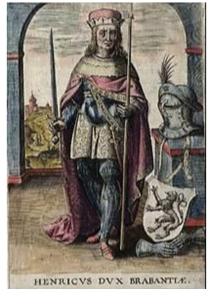
hertog hendrik I van Brabant