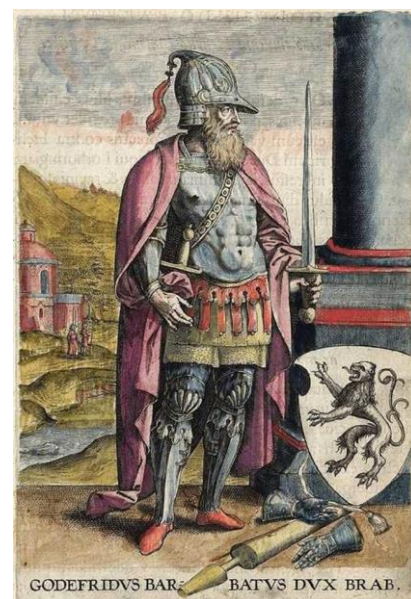
Godfried met de baard

Rond het jaar 1000 vestigde zich rond Leuven een geslacht van opeenvolgende graven, van wie Godfried met de Baard in 1106 de titel 'hertog' verwierf. Zijn opvolgers breidden hun macht uit naar het noorden, over het huidige Noord-Brabant. Omstreeks het midden van de dertiende eeuw had het hertogdom zijn grootste omvang bereikt, maar in 1288 zou ook het hertogdom Limburg worden toegevoegd. Vanaf 1406 kwam het