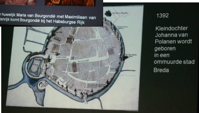
Enkele van de vele getoonde dia's

van de Nassaus zien, Hoe Oranje in de naam is gekomen en hoe de familie in voornaamheid en in rijkdom is gegroeid. Vele belangrijke families hadden connecties en familieverbanden met de Nassaus. Door op tactische wijze huwelijken te sluiten verwierf de familie kapitaal en veel aanzien. De adellijke titels werden steeds belangrijker. Via graven, hertogen enz. kwam de titel prins in de familie. (graaf van Nassau, hertog van Brabant, Prins van Oranje).