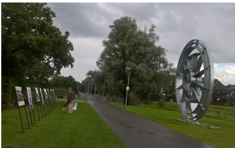
foto Het wiel aan het fietspad

Naast de betrokken gemeenten zijn ook het Brabants Kenniscentrum Kunst en Cultuur en de in het gebied actief zijnde erfgoedinstanties bij het project betrokken. De provincie Noord-Brabant draagt subsidie bij.